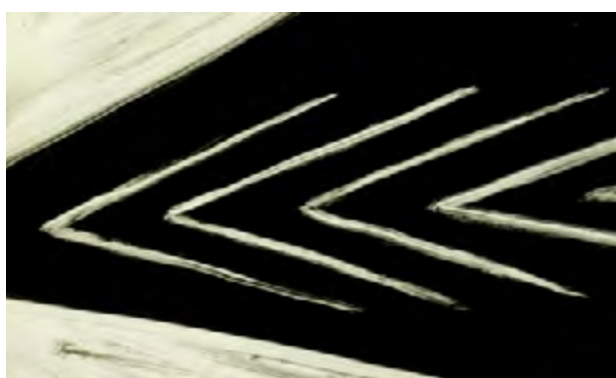
extraits de l'animation réalisée par Agnès Patron (technique de l'encre de gravure sur verre)